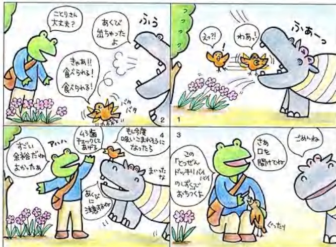
ばっち村の不思議なしずく ~ロックローズ編~